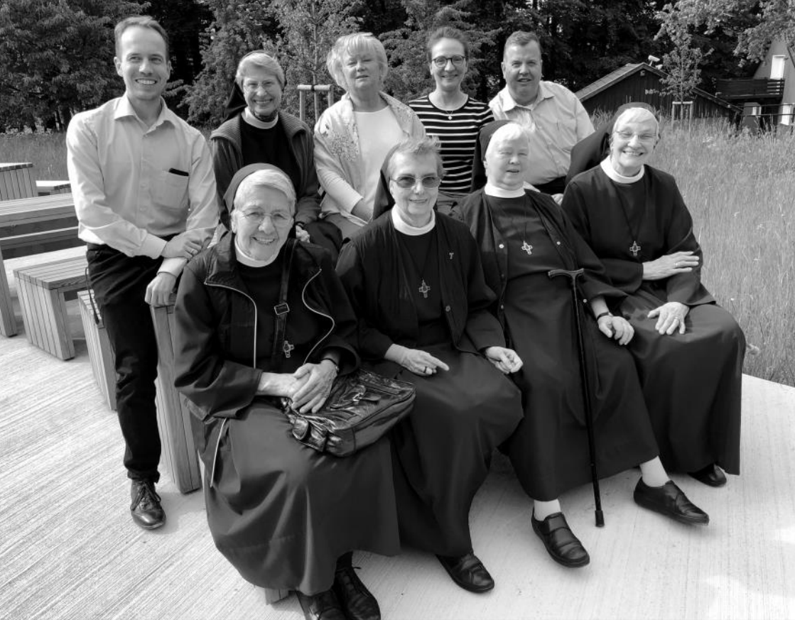
Schwestern des Gertrud-Frank-Konvents mit Mitgliedern des Pfarrgemeinderats St. Jodokus