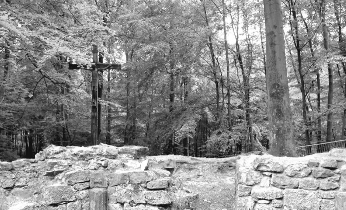
Klosterruine am Jostberg