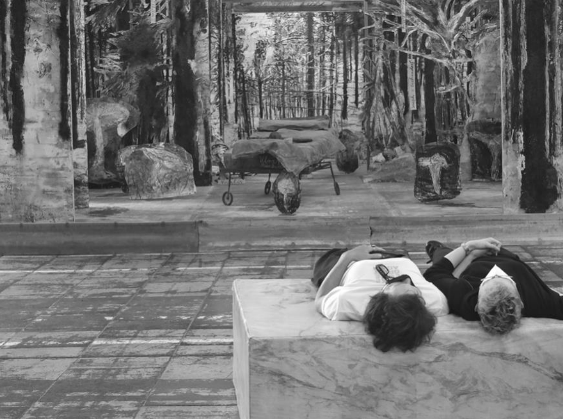
Titel: Anselm Kiefer in DIVERSITY UNITED; Berlin, Moskau, Paris; Sept. 2021